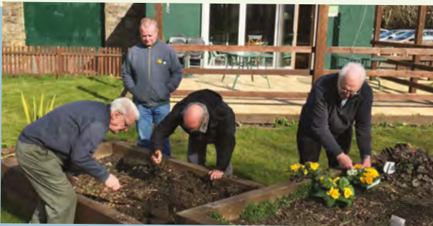
Y Prosiect Taclo Unigrwydd ac Arwahanrwydd