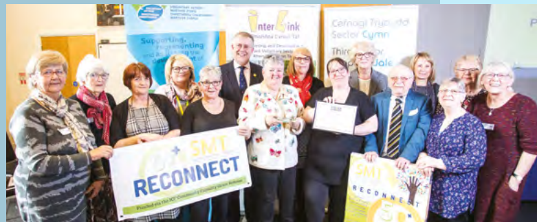
Reconnect 50 • y Safle 1af