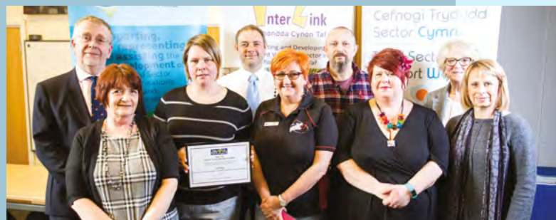
Fit and Fed • 3ydd safle